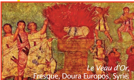
Le Veau d'Or, Fresque, Doura Europos, Syrie.