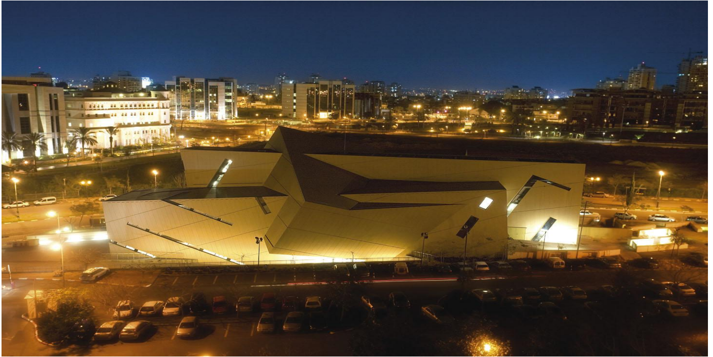
The Wohl Center Bar-Ilan University