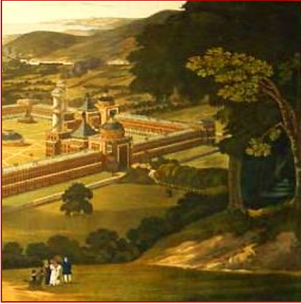
Ville et harmonie, F. Bate, (1838)