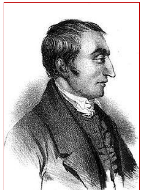
Portrait de Saint Simon (1760-1835)

Au XIXème siècle, des centaines de communautés socialistes ont été créées aussi bien en France, en Angleterre et aux Etats-Unis.