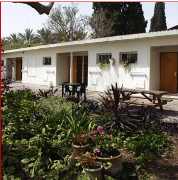
Kibboutz Degania, Israël

Les kibboutzim , de l'hébreu "assemblée", sont des villages collectivistes en Israël, souvent organisés sur la base d'une propriété commune des biens, du partage du travail et de la volonté de développer un système autarcique.