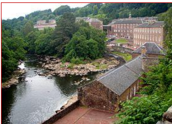
New Lanark, Royaume-Uni,

Dès la fin du XVIIIème siècle, le Britannique Robert Owen est à l'origine de la création de manufactures, basées sur une répartition plus juste des tâches et à la recherche d'une plus grande efficacité des ouvriers.