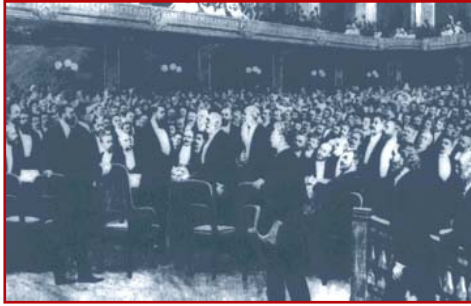
Le premier congrès sioniste (1897)