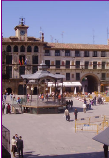
L'une des grandes places de Tudèle, la ville de naissance de Juda Halévy