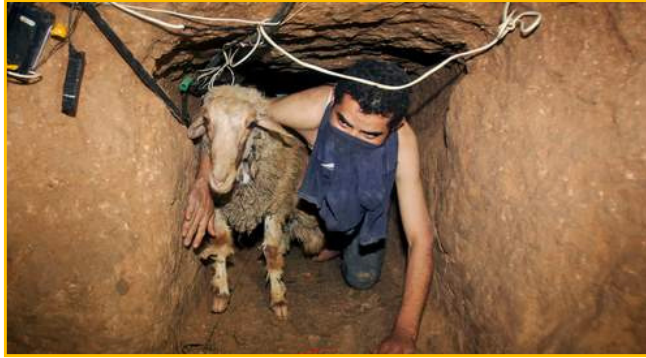
Un soldat israélien dans un tunnel découvert par l'armée israélienne. Il a été creusé par des Palestiniens entre une maison de Rafah, dans la bande de Gaza, et l'Égypte, (15 mai 2002)

Gaza : une base de lancement de missiles