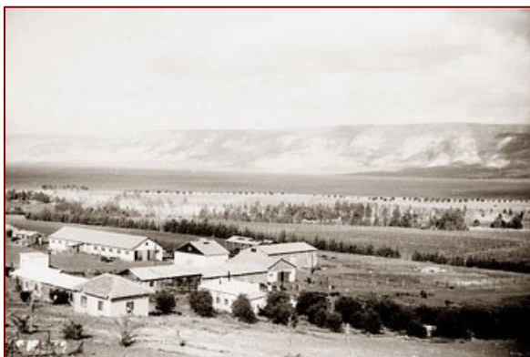
Le kibboutz Degania à ses débuts