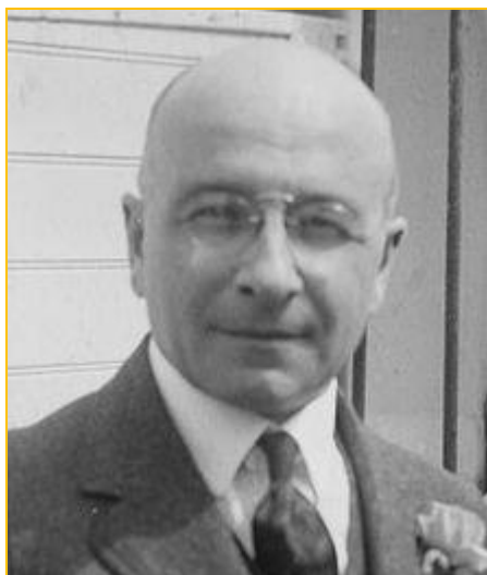
Alexis Carrel, prix nobel de physique en 1912