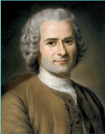
Jean-Jacques Rousseau (1712-1778), le philosophe du Contrat social