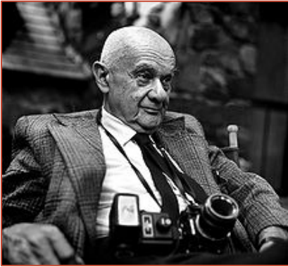
Roman Vishniac en 1977