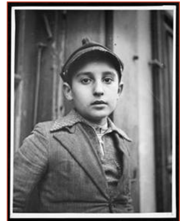
Bar Mitzvah boy, Lublin, Pologne, 1935-1938. Vishniac se focalise sur la piété, la pauvreté et les persécutions vécues par les communautés rencontrées.

Suite à la révolution bolchévique, Roman Vishniac s'installe à Berlin. Là, il commence lors de l'arrivée d'Hitler au pouvoir à photographier les conséquences du nazisme sur la vie des juifs d'Allemagne. Puis il poursuit cette exploration du judaïsme d'Europe de l'est en Pologne, en Roumanie, en Tchécoslovaquie. C'est ainsi qu'il est recruté en 1937 par l'American Jewish Joint Distribution Committee (JDC) : jusqu'à la seconde Guerre mondiale, le JDC va utiliser les photographies de Vishniac pour alerter sur le sort des juifs dans ces pays. En 1940, elle aide le photographe à se réfugier aux États-Unis.