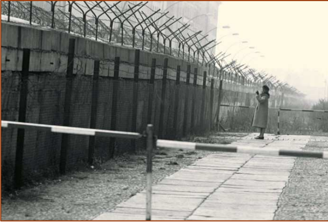
De 1962 à 1989, Le mur de Berlin, symbole vivant de la Guerre froide