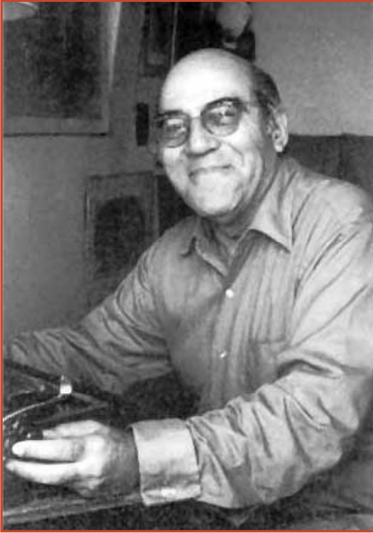
Emmanuel Roblès (1914-1995).