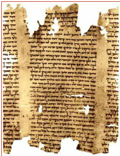
Manuscrits de la Mer Morte

Les préceptes véhiculés par ces textes sont très proches de l'enseignement de Jésus. Ils prônent l'amour des autres et la non-violence, et l'attente d'un messie dit « le maître de justice ».