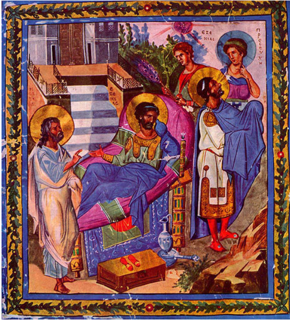
Le roi Ezéchias malade et le prophète Isaïe.