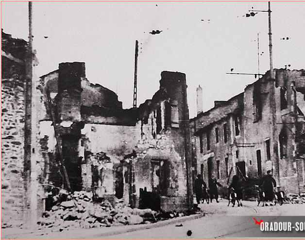
Le village après l'incendie