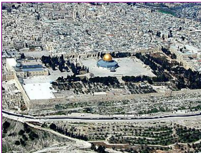
Selon la tradition, c'est sur le futur mont du Temple qu'Abraham ligote Isaac.

Ton fils : Abraham lui dit : j'ai deux fils. Il lui répondit : ton unique. Il lui dit : ils sont chacun unique par leur mère. Il lui dit : que tu aimes ! Il répondit : je les aime tous les deux. Il lui dit : Isaac. Et pourquoi Dieu ne révéla-t-il de suite (le nom d'Isaac), afin de ne pas le perturber, car il en aurait perdu l'esprit, et aussi pour lui faire aimer la mitsva et lui donner une récompense pour chaque parole.