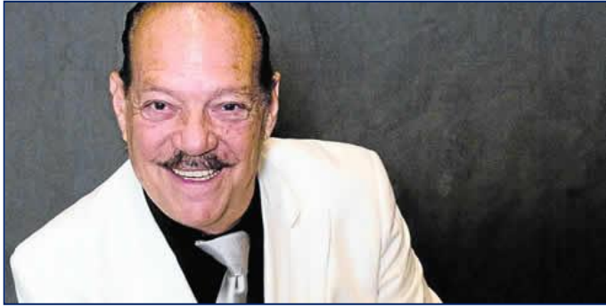
Larry Harlow, "le Merveilleux Juif".