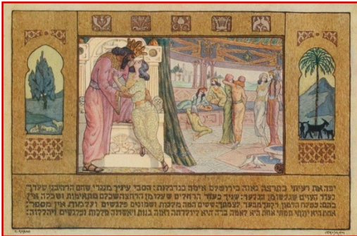
Cette lithographie de Zeev Raban fait partie d'une série d'illustrations (1923) du Cantique des cantiques : "Tu as capté mon cœur, ô ma sœur, ma fiancée, tu as capté mon cœur par un de tes regards, par un des colliers qui ornent ton cou" ( Hagiographes Cantique des cantiques ch. 4, v. 9, () )