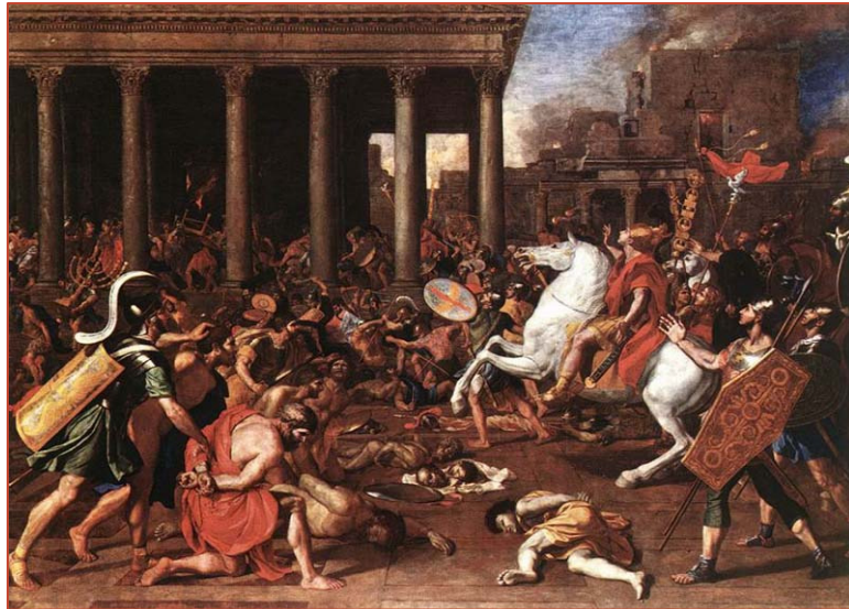
Destruction du Temple de Jérusalem, Nicolas Poussin, 1640

« C'est l'humilité de Rabbi Zacharie qui occasionna la destruction de notre maison : Dans le sens où il s'humiliait devant la Loi de Dieu, sans tenir compte des implications tragiques qui voulaient en découler pour tout le peuple d'Israël, dans ce cas de figure.