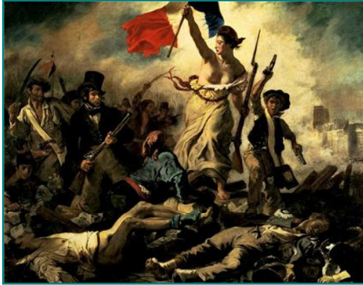
La liberté guidant le peuple, Eugène Delacroix.