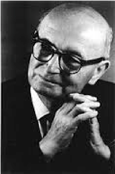
Shelomo Dov Goiten

30 ans de recherches sur la Guéniza du Caire