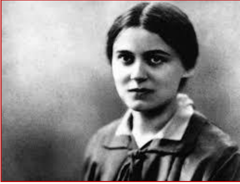
Edith Stein en 1936