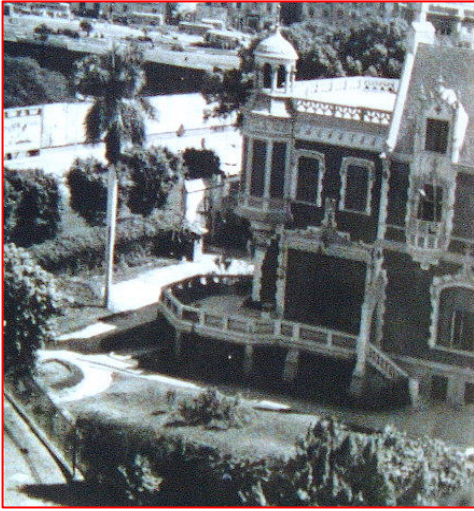
Villa Cattai au Caire