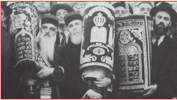
Rabbi Chalom Messas en 1949 (à gauche)