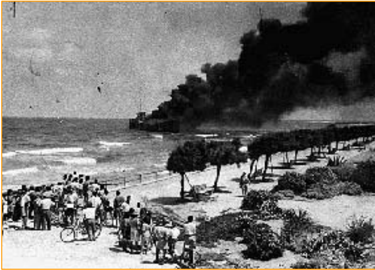
Altalena en flammes. Tel-Aviv, juin 1948