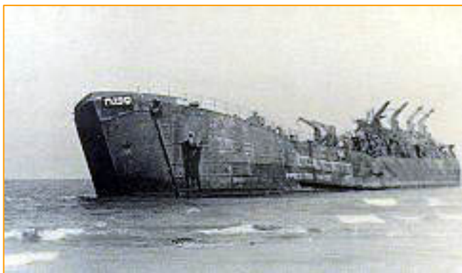
Le bateau d'Altalena – 800 immigrants et des armes pour l'Irgoun