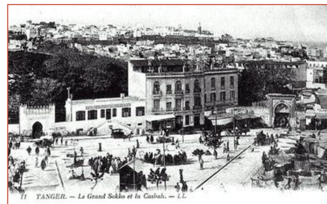
Le grand Sokko et la Casbah de Tanger