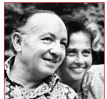
Léon Klinghoffer et sa femme

Le lendemain, le gouvernement syrien refuse au bateau l'accès au port. Les terroristes mettent leurs menaces à exécution. A bord de l' Achille Lauro , une sélection est faite parmi les otages. Léon Klinghoffer , un retraité américain juif et paraplégique est tué de deux balles. Les terroristes le jettent par-dessus bord avec son fauteuil roulant . Il sera la seule victime, rappelant dramatiquement les pratiques allemandes durant la Seconde Guerre mondiale . Léon Klinghoffer a été abattu parce que juif . Cette froide réalité ne manquera pas de marquer les esprits à travers le monde et de faire date dans l'histoire du terrorisme.