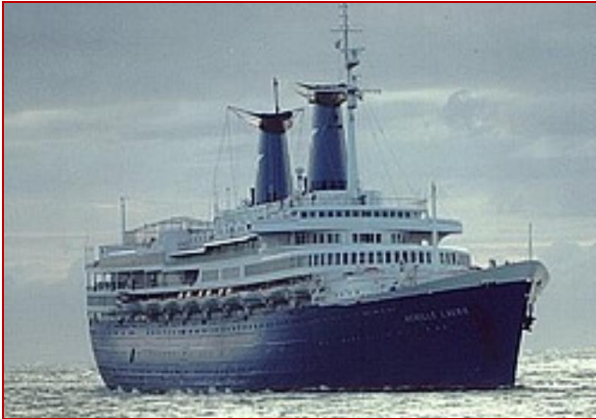
L'Achille Lauro, 1987