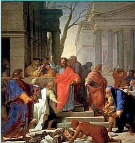
La prédication de Paul, Eustache Le Sueur (1616-1655).