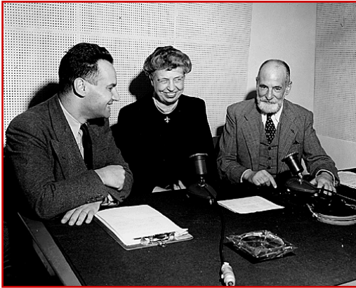
René Cassin (à droite), représentant français à la Commission des Droits de l'Homme de l'ONU et Eleanor Roosevelt (26 juin 1947), UN Archives.