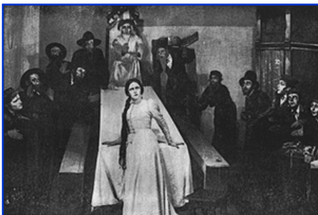
Représentation du « Dibbouk ». Moscou, 1922

Ansky reste à ce jour l'une des figures les plus marquantes de la littérature juive. Son travail aura eu un impact considérable sur ses contemporains et les générations futures. Sa pièce, « Le Dibbouk », est ainsi une œuvre majeure du répertoire yiddish et hébreu. Elle a été traduite et jouée dans beaucoup de langues, a inspiré de nombreux films, un ballet et même un opéra.