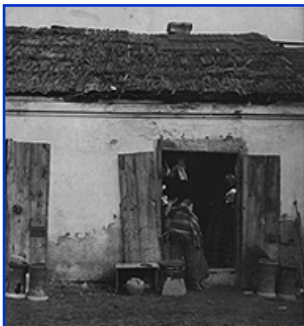
Un magasin juif, photo prise lors de l'expédition de Ansky

De retour à Saint-Pétersbourg en 1905, il rejoint le Bund. L'un de ses poèmes, « Die Shvue », devient d'ailleurs l'hymne du parti. Inspiré par l'écrivain de langue yiddish et hébraïque I. L. Peretz, Ansky se tourne de nouveau vers la culture juive et commence à écrire en yiddish, œuvrant au développement de la littérature et du théâtre yiddish. Entre 1911 et 1914, il voyage à travers les villages de Volhynie et Podolie, à la tête de l'expédition ethnographique juive financée par le Baron Vladimir Guenzburg. Cette expérience aura une influence déterminante sur son travail littéraire. Sa connaissance en profondeur du folklore juif l'inspirera d'ailleurs dans l'écriture de sa célèbre pièce « Le Dibbouk ». La révolution de 1917 l'oblige à s'exiler définitivement. Il s'installe à Vilnius puis, à la fin de la première guerre mondiale, à Varsovie où, à l'âge de 56 ans, il meurt des suites d'une pneumonie.