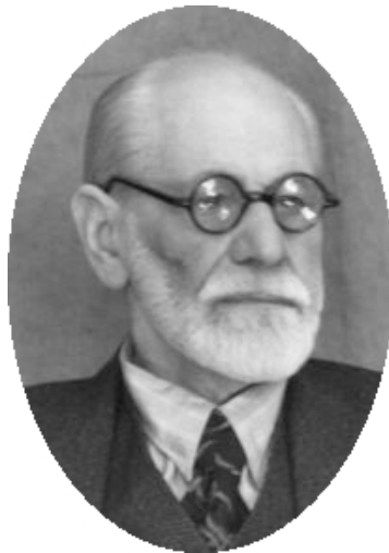
Sigmund Freud Psychanalyste

Voir le sites suivants : La psychanalyse , par René Degroseillers magapsy.com