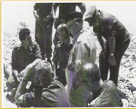
10 juin 1967 : sur les hauteurs du Golan, le Premier ministre Eshkol, Moshé Dayan et David Elazar