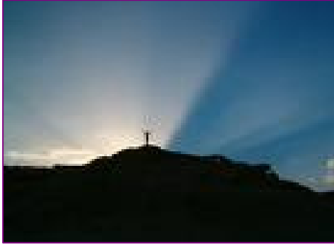
Un peuple porteur de lumière