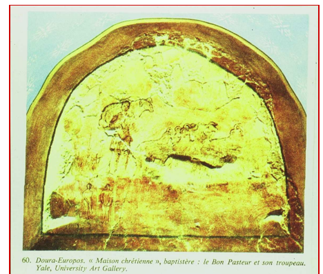
60. Dura-Europos. « Maison chrétienne », baptistère : le Bon Pasteur et son troupeau. Yale, University Art Gallery.

Salle baptismale, baptistère, Dura-Europos, II e s.