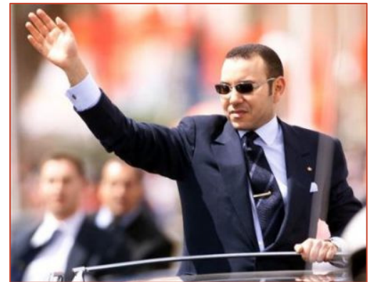
Le roi Mohammed VI, fils d'Hassan II et petit-fils du roi Mohammed V. Il a mis le pays sur la voie de la modernisation.

La Constitution du Maroc est rédigée en 1962 par le roi Hassan II, au moment où le pays obtient son indépendance. L'essentiel des pouvoirs est concentré entre les mains du roi, monarque héréditaire, qui nomme le premier ministre en tenant compte de la majorité du parlement. Actuellement, le pouvoir exécutif est exercé par le gouvernement. Le pouvoir législatif, bicaméral, est exercé par la chambre des représentants composée de 325 membres élus tous les cinq ans au suffrage universel, et la chambre des conseillers qui comprend 270 membres renouvelés par tiers tous les trois ans.