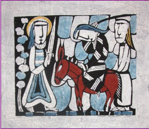
L'ânesse de Bileam appartient aux éléments créés la veille de chabat lors de la création du monde