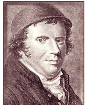
Israël Jacobson, un des pionniers de la réforme en Allemagne

Au début du XIXe siècle, dans le sillage de la Haskalah, la réforme du judaïsme apparaît en Allemagne. Plusieurs personnalités sont engagées dans le mouvement dont le rabbin Samuel Holdheim, à l'origine de réformes radicales.