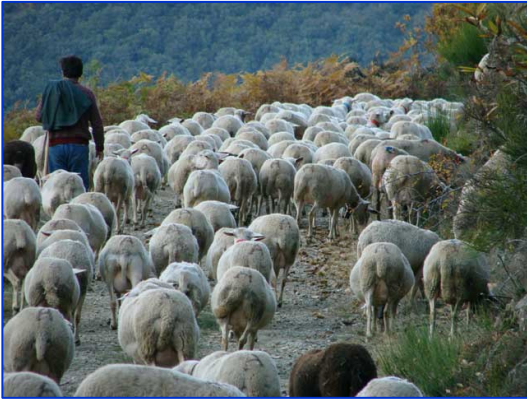
Berger est l'un des premiers métiers du monde. Ce fut le métier d'Abel, des Patriarches, de Moïse ou de David.