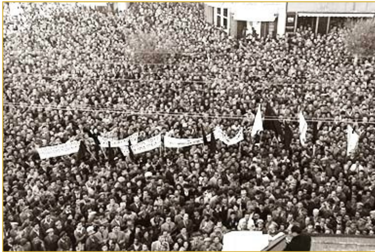
Des manifestations avec à leur tête Begin sont organisées pour protester contre les relations avec l'Allemagne