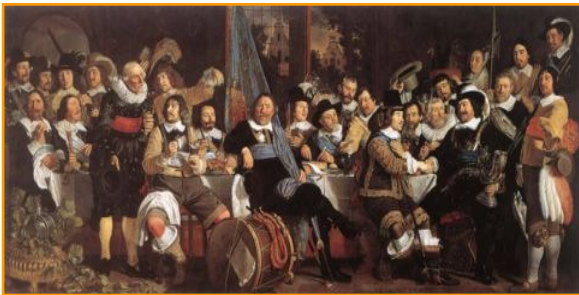
Münster , Bartholomeus van der Helst, (1648)