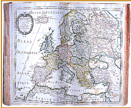
Tiré de L'Europe nouvelle de Sanson d'Abbeville, géographe ordinaire du roi, 1658.