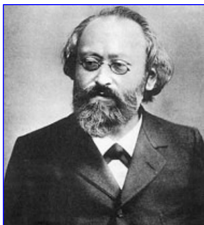
Max Bruch, chef d'orchestre en Europe