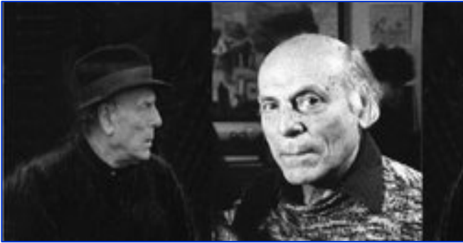
Gherasim Luca et l'objet Héros-Limite

Ghérasim Luca lit lui-même ses poèmes, joue avec les structures syntaxiques, fait bégayer la langue, qu'il fonde essentiellement sur des jeux de mots et des balbutiements maîtrisés, par séquences et saccades. Son travail manifeste, depuis le début, une véritable obsession de la mort sous toutes ses formes.