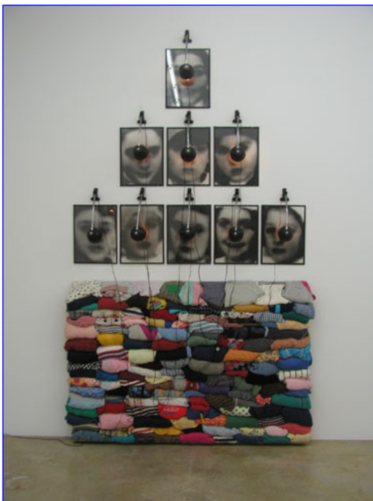
1 - Réserve : vêtements, photographies en noir et blanc et lumières, 1989

Le travail de Christian Boltanski s'appuie sur divers matériaux pour un rendu souvent extraordinaire. Panorama d'une œuvre en quelques images.