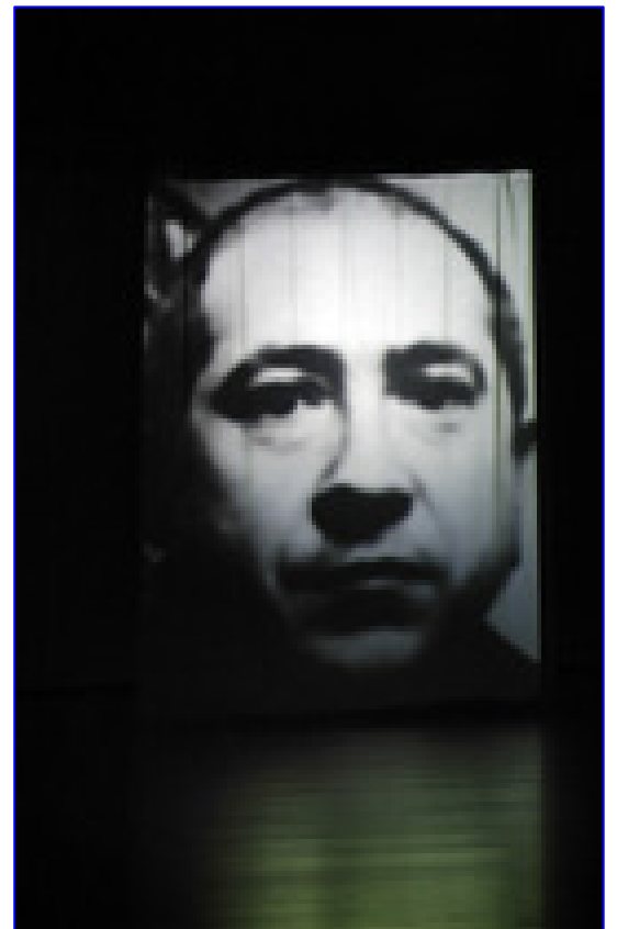
Entre temps, 2007