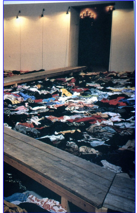
Réserve : Lac des morts, 1990