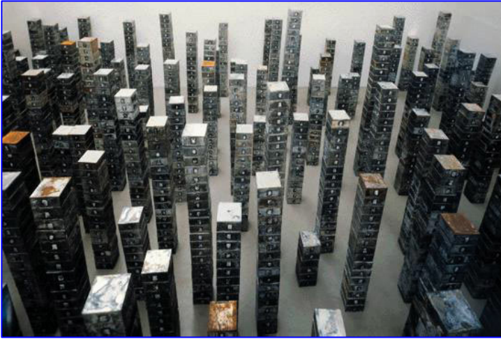
Réserve de Suisses morts, 1991