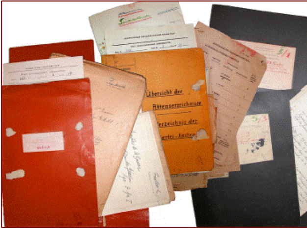
Inventaires allemands des dossiers militaires Ouest européens détenus dans les Heeresarchiv, le dépôt d'archives top secrètes de Berlin-Wannsee.