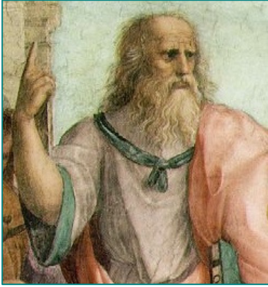
Platon selon Raphaël, détail de l'Ecole d'Athènes