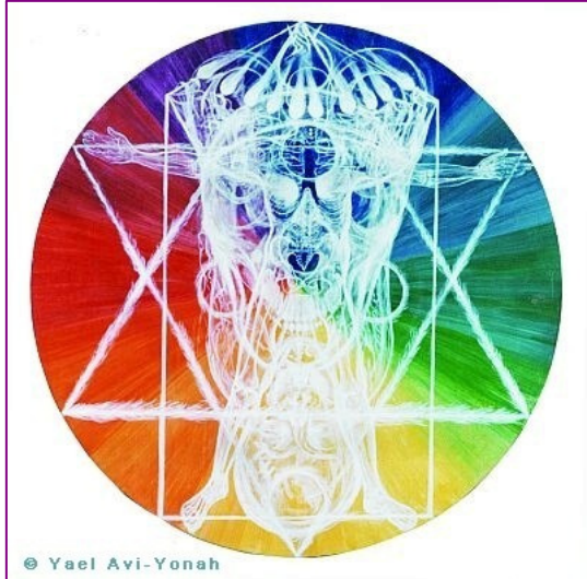
Le corps humain dans un symbolique cabaliste.