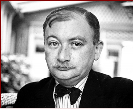
Joseph Roth, le nostalgique de l'Empire