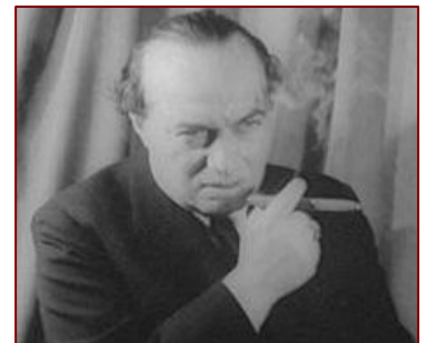
Werfel est imprégné très jeune de la foi catholique

1940: Le couple visite Lourdes où Werfel s'intéresse à Bernadette Soubirous. Il lui dédie un livre Le Chant de Bernadette , signe de son intérêt pour le catholicisme même s'il ne s'est jamais converti.