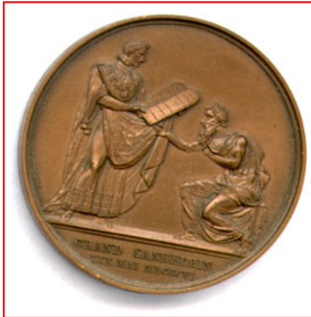
Médaille du Grand Sanhédrin. Napoléon donne les tables de la loi à Moïse.