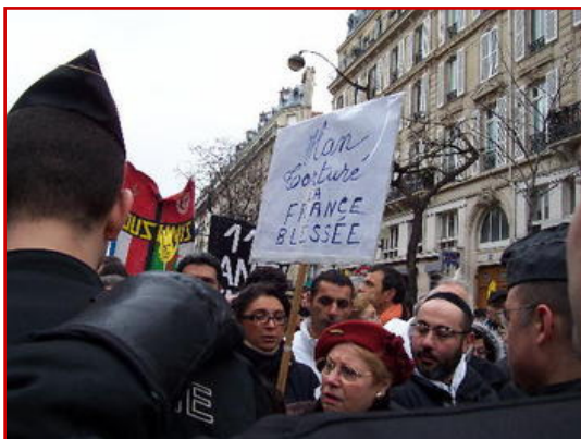
Manifestation à Paris après l'assassinat d'Ilan Halimi.