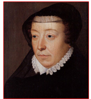
Catherine de Médicis (1519-1589)

Le 17 janvier 1562 : le roi Charles IX signe l' Edit de tolérance de Saint-germain (du nom du château où a lieu la signature). Le texte a été préparé par sa mère, Catherine de Médicis, régente du royaume. Cet Édît confère aux protestants français le droit de célébrer le culte à l'extérieur des villes fortifiées ainsi que de tenir des assemblées dans les maisons privées à l'intérieur de ces mêmes villes. Paradoxalement, cette mesure attise la haine entre les catholiques et protestants.